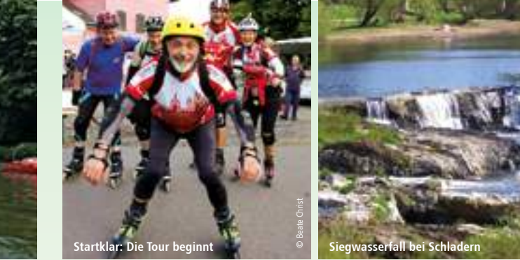
Startklar: Die Tour beginnt