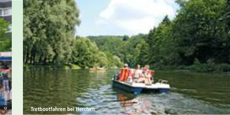
Tretbootfahren bei Herchen