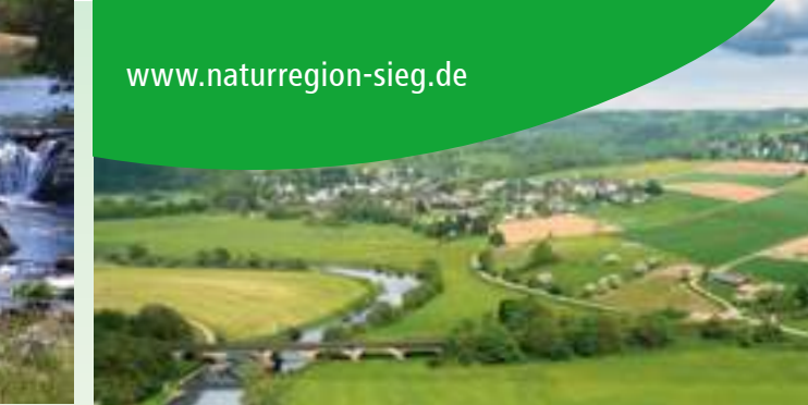
Siegwasserfall bei Schladern