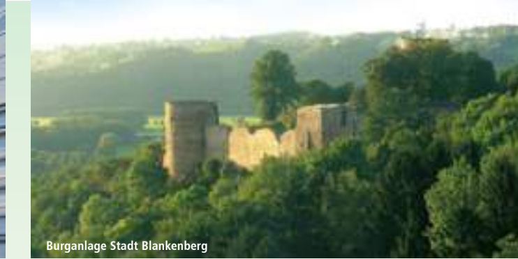
Burganlage Stadt Blankenberg