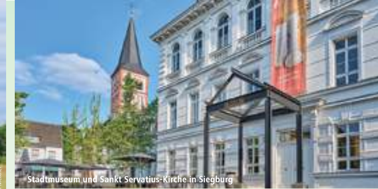
Stadtmuseum und Sankt Servatius-Kirche in Siegburg